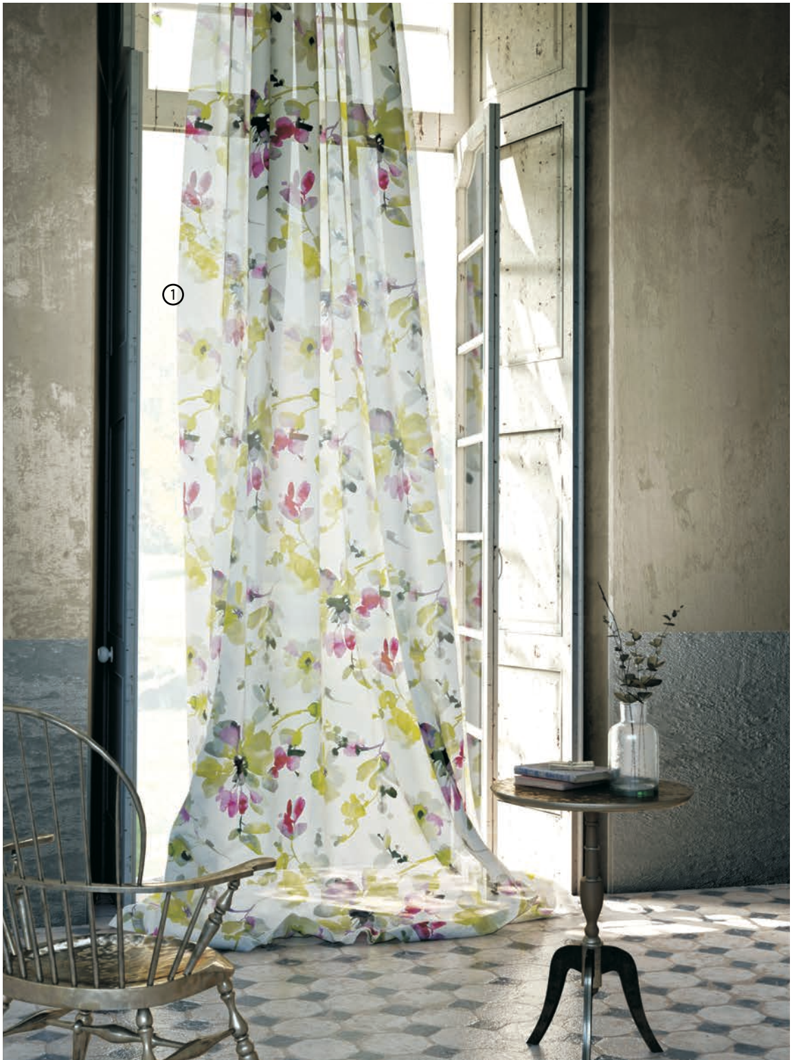
1 CO-L-5027-8 85 % poliéster, 15 % lino