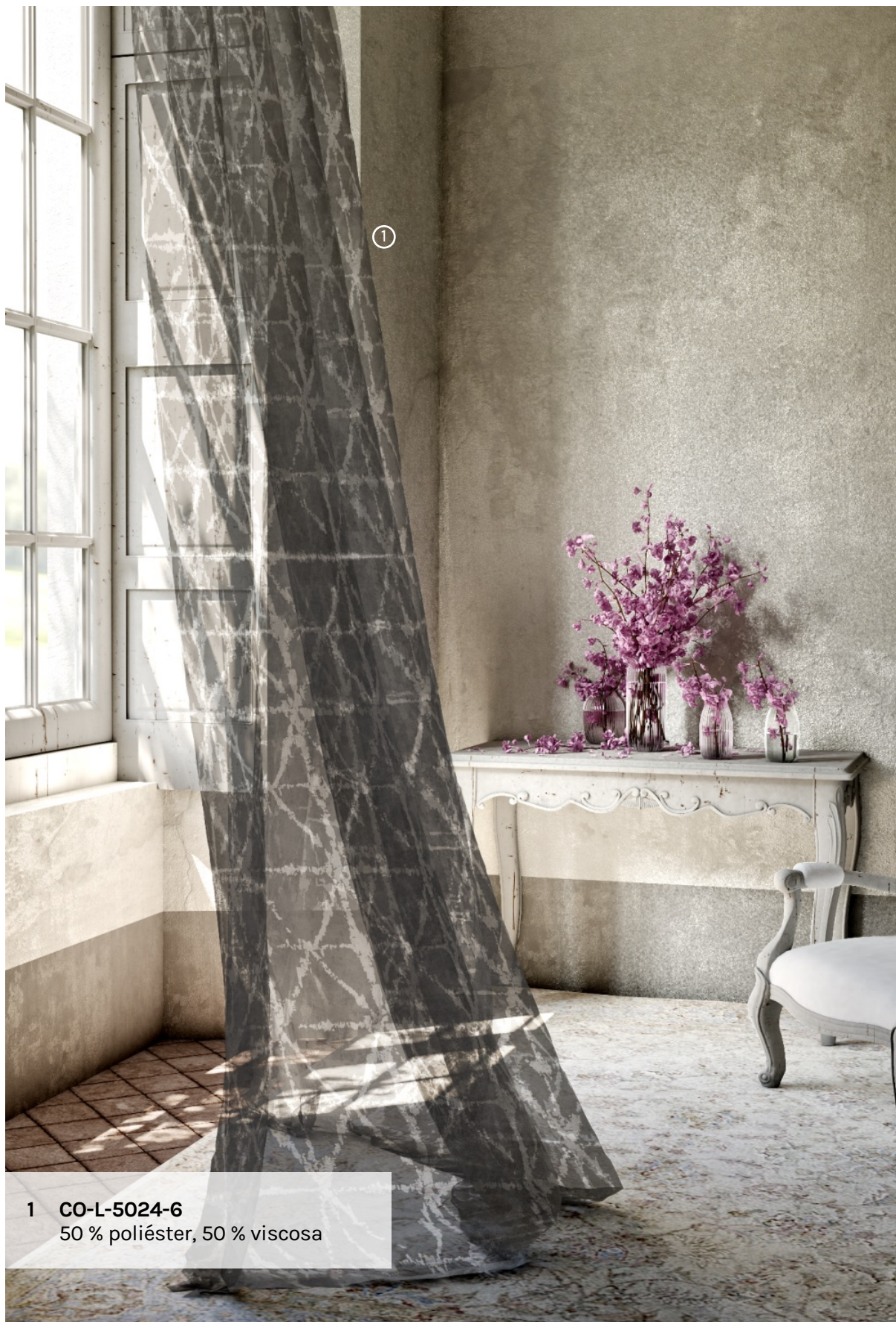
1 CO-L-5024-6 50 % poliéster, 50 % viscosa