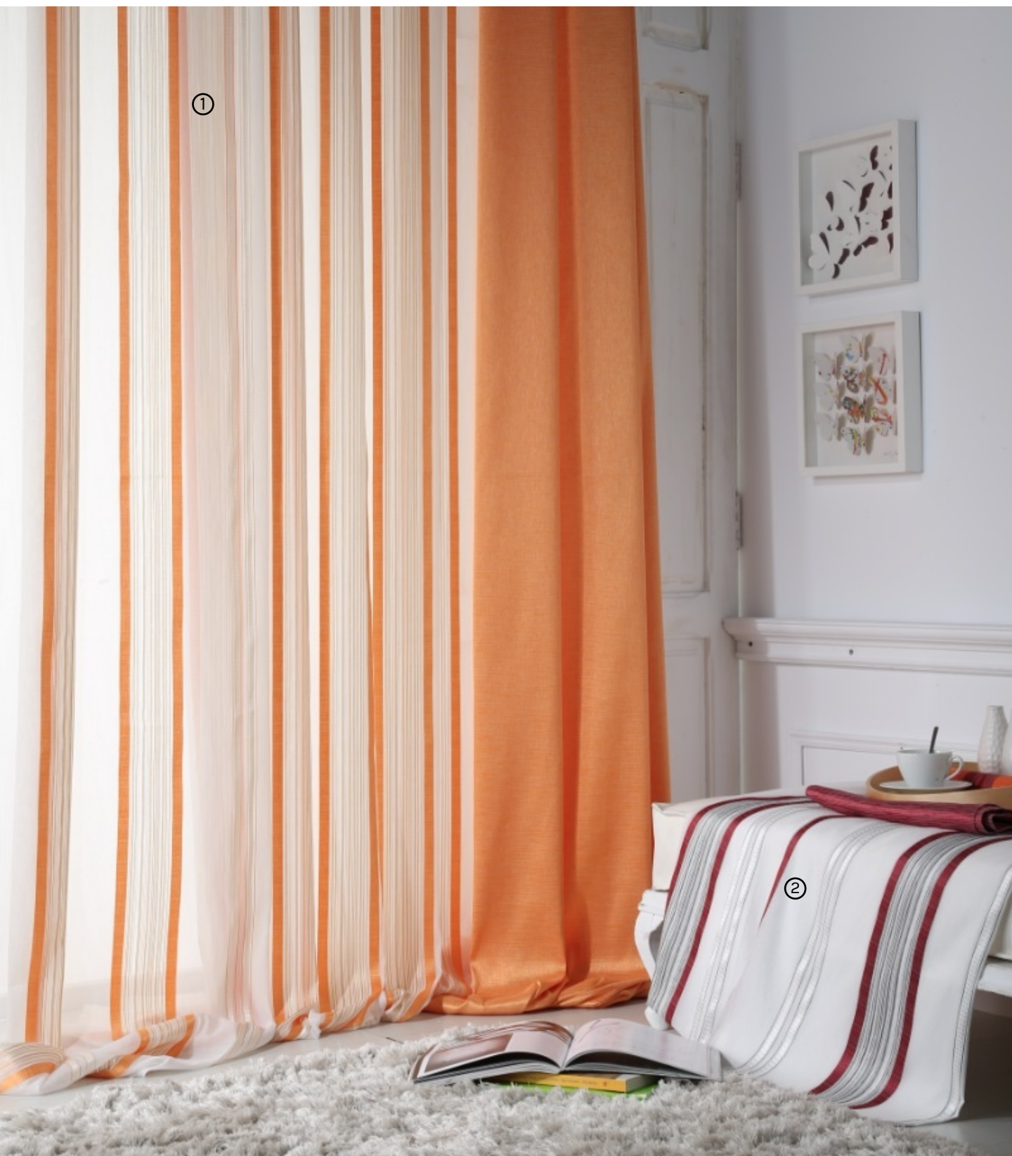
1 CO-L-5019-7 100 % poliéster